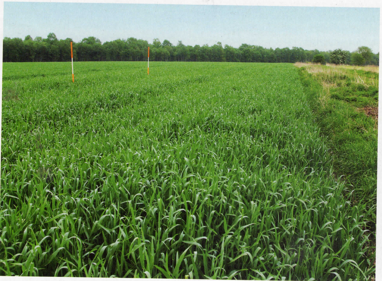
Die Grenze der Feldwegparzelle reicht bis zu den Stangen; ca. 7 m werden der Natur entzogen

§ 919 Grenzabmarkung und § 920 Grenzverwirrung.